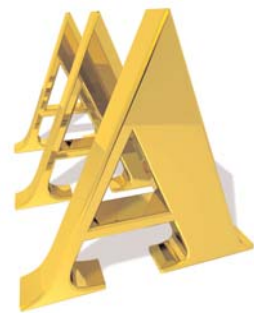
Evoluzione dell'Indice benchmark del Lyxor ETF EuroMTS AAA Government Bond